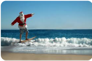
(Erlebnis Fernreisen/ Eurotext AG)

Highlights sind der Austausch von Weihnachtsgeschenken, Familienessen wie Truthahn und Meeresfrüchte, das Feiern von "Christmas Crackers" und der Besuch von Open-Air-Konzerten wie "Carols in the Domain". Der 26. Dezember ist bekannt als der "Boxing Day", der mit dem Beginn des Winterschlussverkaufs und dem Start vieler Sommerurlaube einhergeht.