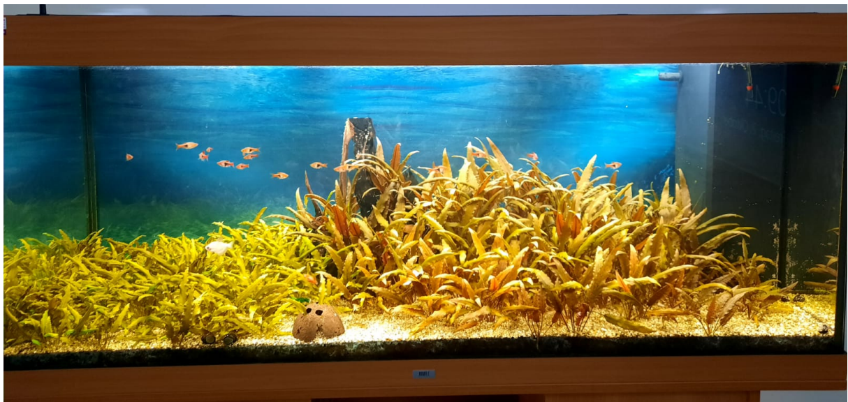
Das alte Aquarium: manche Pflanzen ließen kaum noch Platz am Boden

Der Fachbereich Biologie bedankt sich bei Ali, Luca und Jonas und beim Förderverein, der das nötige Geld in Höhe von ca. 265 € beigesteuert hat.